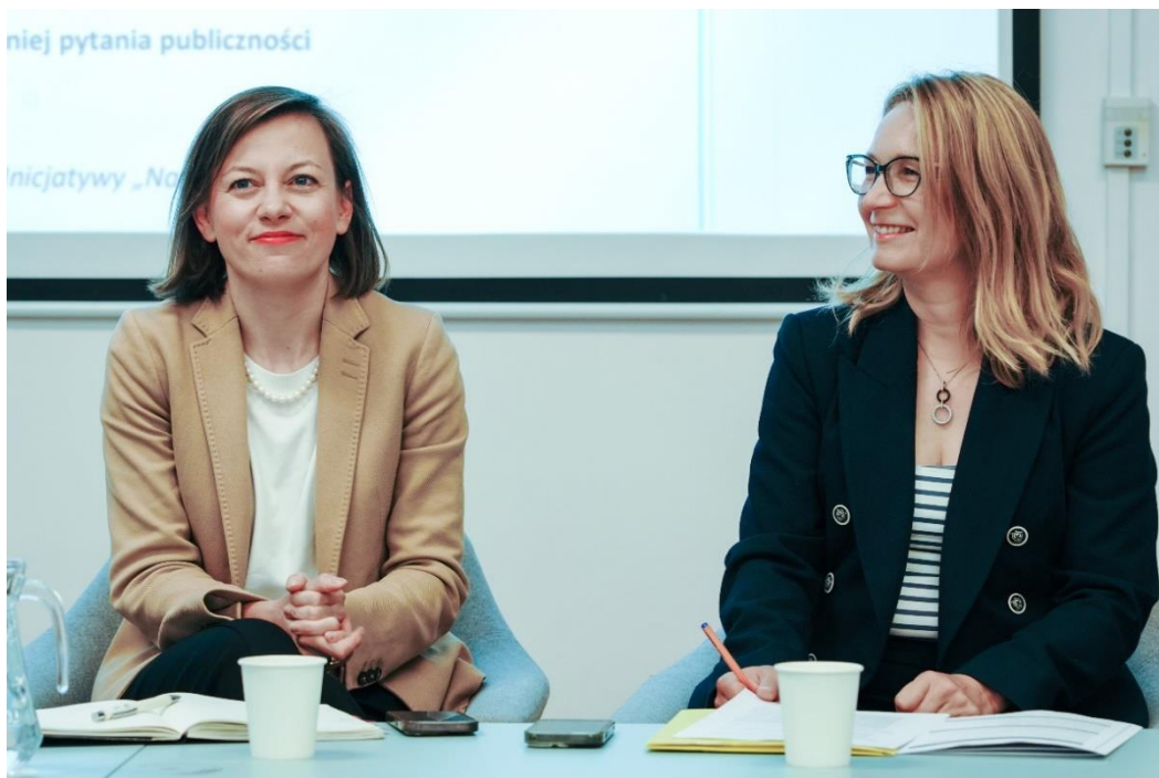
Konferencja „Polska w Unii Europejskiej - jakich praw chcemy na co dzień?”

10 maja 2024 r. Stowarzyszenie zorganizowało konferencję „Polska w Unii Europejskiej - jakich praw chcemy na co dzień?” z udziałem przedstawicieli/lek strony rządowej, Biura RPO, RPD, RPP, UODO, UOKiK i kilkudziesięciu NGOów z całej Polski.