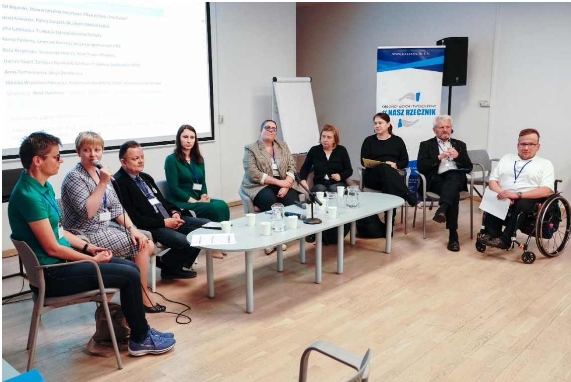
Fot. Konferencja „Polska w Unii Europejskiej - jakich praw chcemy na co dzień?”, Jakub Szafrński

Ważnym filarem był panel „Wybory dostępne dla wszystkich”. Wzięli w nim udział ekspertki/ci Biura RPO oraz organizacji zaangażowanych w akcję dostępnych wyborów, w tym przedstawicielki Stowarzyszenia 61 oraz Fundacji Odpowiedzialna Polityka.