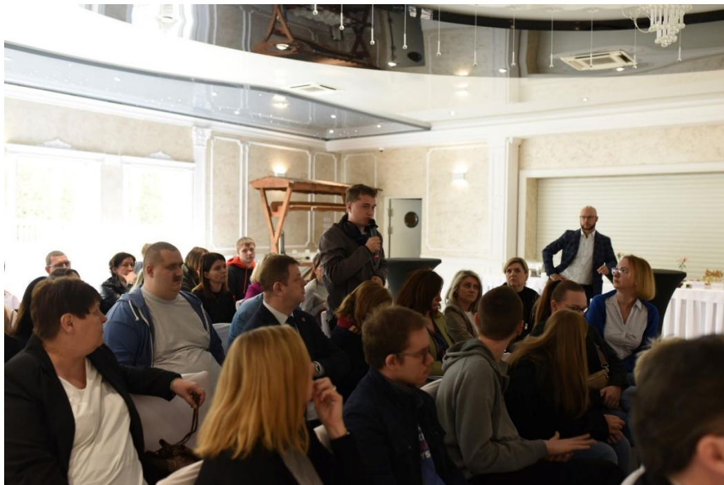
Fot. Debata lokalna „Szkoła bez barier” Fundacji Pro Aperte; Kutno, kwiecień 2024

Współorganizowaliśmy cztery debaty lokalne w obszarach edukacji włączającej, ochrony środowiska, praw osób z niepełnosprawnościami i osób uchodźczych.