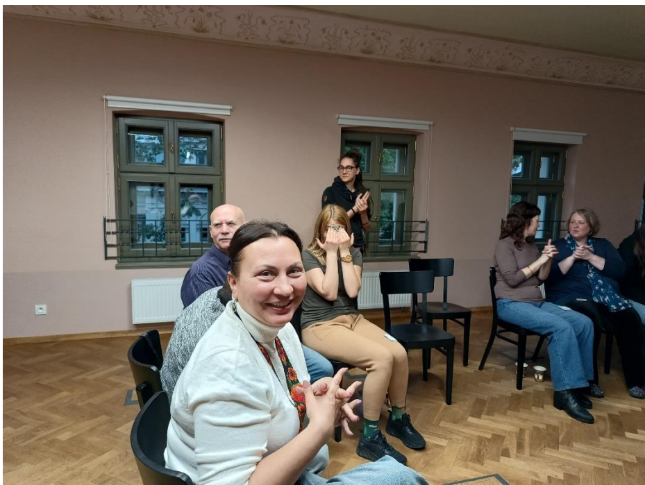
Fot. Warsztaty wytnieniowe dla Inicjatywy „Nasz Rzecznik” w Łodzi, październik 2024 r.

W 2024 r. Stowarzyszenie realizowało też projekt warsztatów wytnieniowych w Łodzi, prowadzonych przez Olgę Ślepowrońską (Stowarzyszenie Mudita) przy finansowym wsparciu europejskiej Inicjatywy „Civitates”.